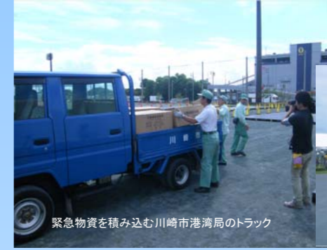
緊急物資を積み込む川崎市港湾局のトラック

発災時、公園内は広域支援部隊(自衛隊、消防、警察等)の活動拠点として活用されるため、ベースキャンプのエリアを設置する訓練を実施した