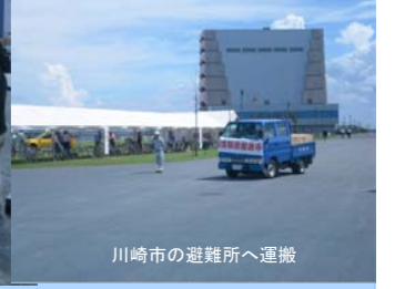
川崎市の避難所へ運搬