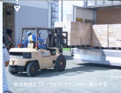
緊急物資をフォークリフトでテント内へ搬入する