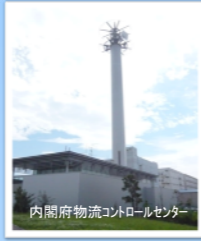
内閣府物流コントロールセンター