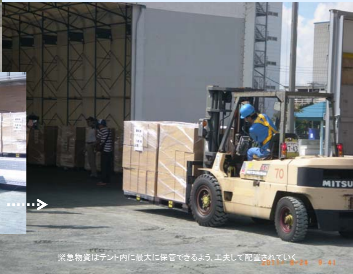
緊急物資はテント内に最大に保管できるよう、工夫して配置されている