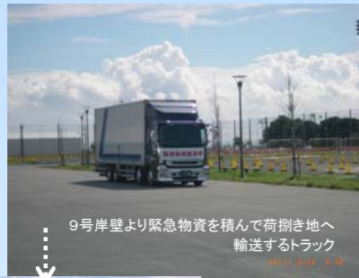
9号岸壁より緊急物資を積んで荷捌き地へ輸送するトラック

災害発生時における緊急物資輸送の中継基地となる防災拠点で、貨物船とトラックを使用する海陸間の輸送訓練を行い、内閣府・関東運輸局・川崎市港湾局・川崎港運協会等の関係機関との物流コントロールシステムの確認、連携強化を図るための訓練を実施した。併せて広域支援部隊(自衛隊・消防・警察等)が活動するエリアを設置する訓練を実施。