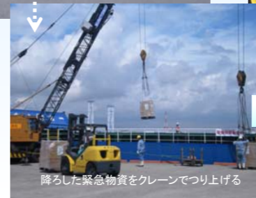
降ろした緊急物資をクレーンでつり上げる