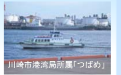
川崎市港湾局所属「つばめ」