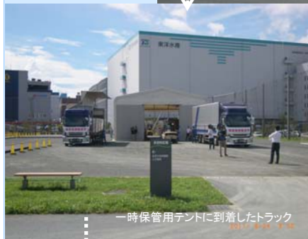
一時保管用テントに到着したトラック

テントに一時保管された緊急物資を31号岸壁に運搬し、貨物船へ積み込み、在庫管理する訓練を実施した