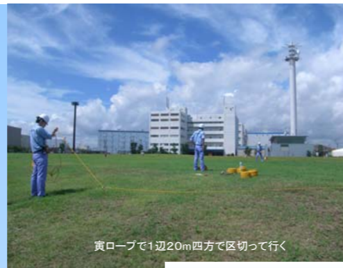
黄ロープで1辺20m四方で区切って行く

被災地から緊急物資の運搬要請を受けたことを想定し、緊急物資の運送のため要請内容を伝達する訓練を実施