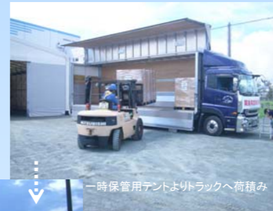
一時保管用テントよりトラックへ荷積み