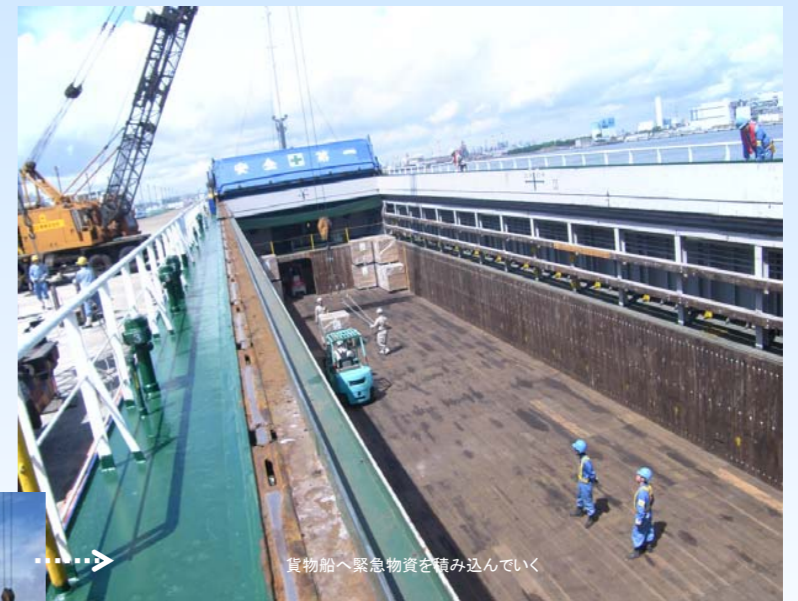
貨物船へ緊急物資を積み込んでいく