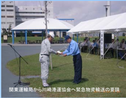
関東運輸局から川崎港運協会へ緊急物資輸送の要請