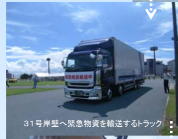
31号岸壁へ緊急物資を輸送するトラック

緊急物資輸送要請を受理した中継基地が、物資を受け入れ、荷捌き地(多目的広場)に設置されたテントに一時保管し、在庫管理する訓練を行った