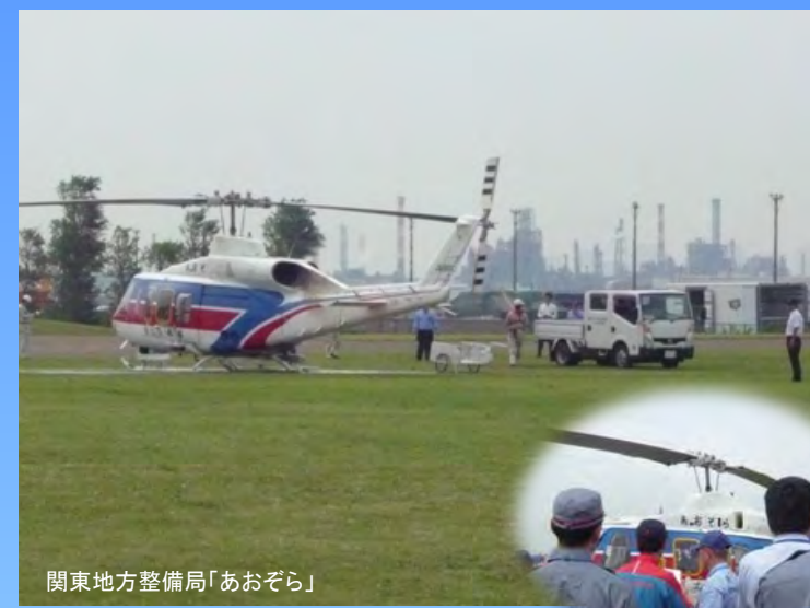
関東地方整備局「あおぞら」