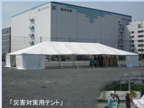
「災害対策用テント」

発災時は物資輸送の中継基地として、緊急物資を効率的に輸送 できるよう整理するための仕分けスペース等として使用を想定。