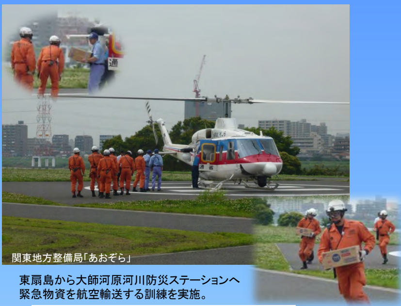
関東地方整備局「あおぞら」