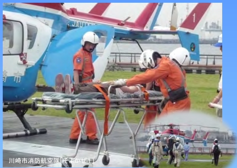
川崎市消防航空隊「そよかぜ」