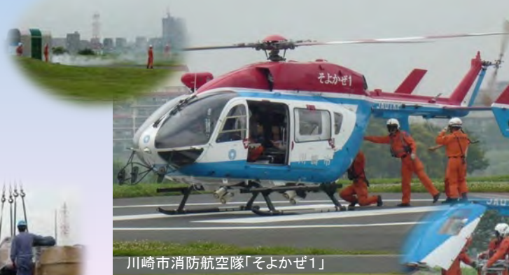
川崎市消防航空隊「そよかぜ1」

東扇島舟運岸壁にて積み多摩川を遡上、 地域防災拠点の大師河原河川防災ステーション 緊急船着き場にて緊急物資を陸揚。